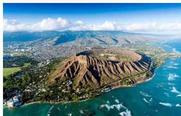
ダイヤモンドヘッド