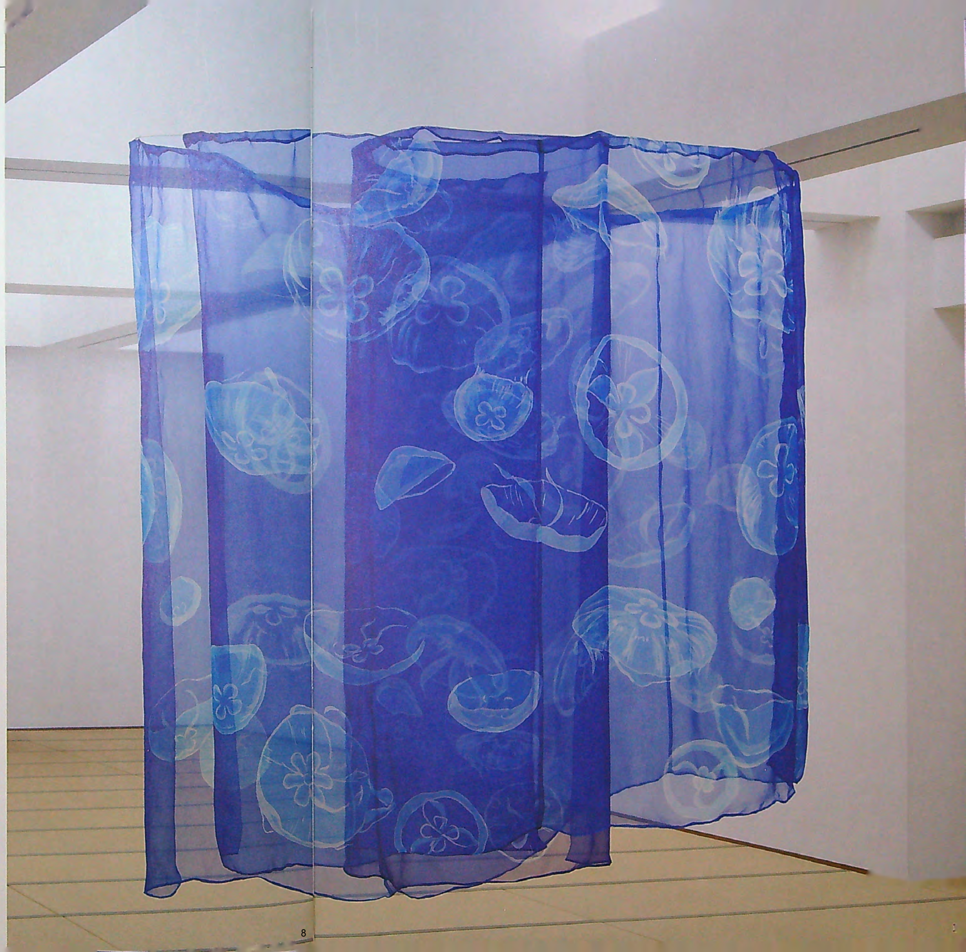
水槽の中の自由 210×200×200cm 2017年制作