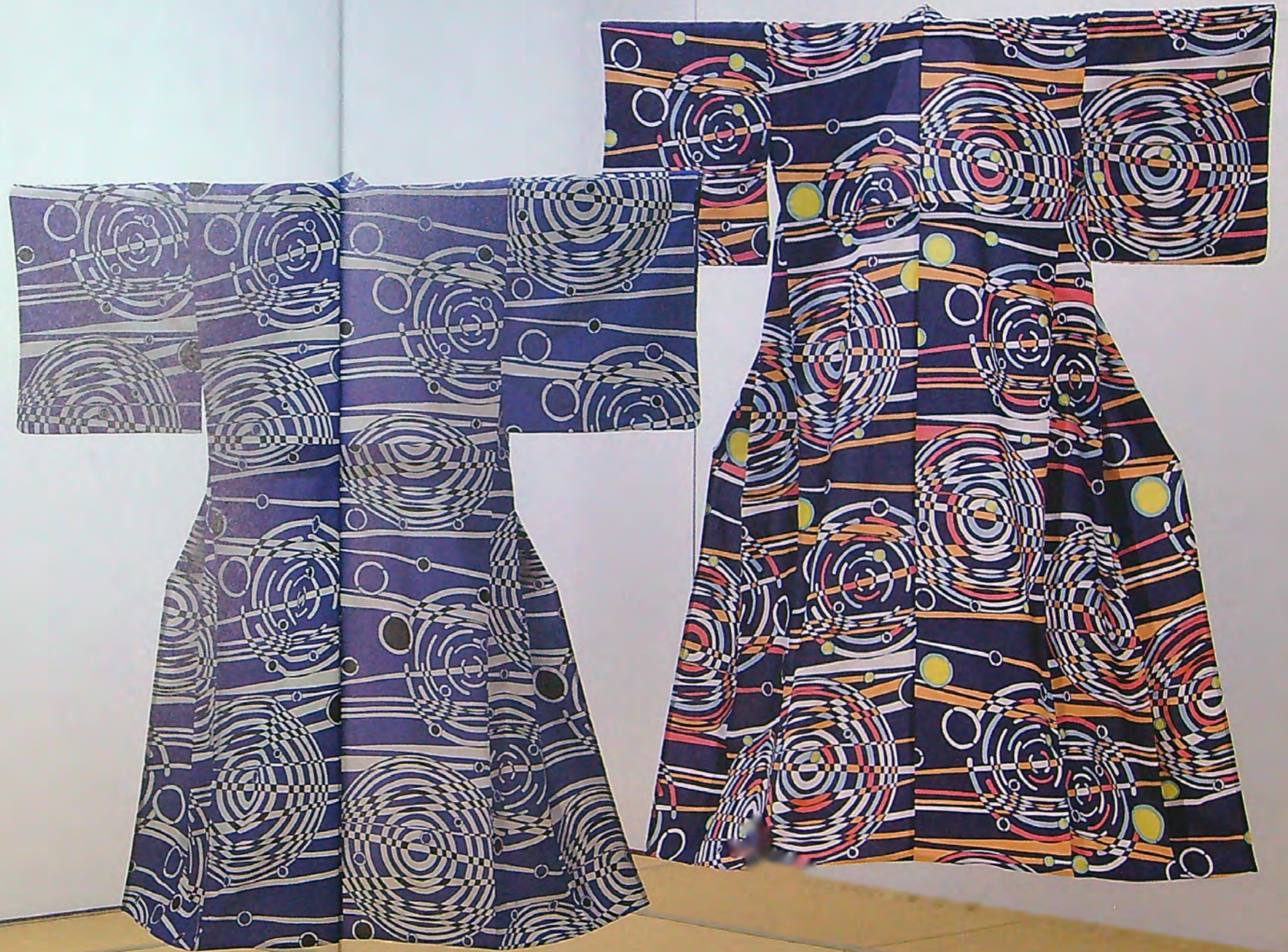
波紋 波紋Ⅱ 2016年制作