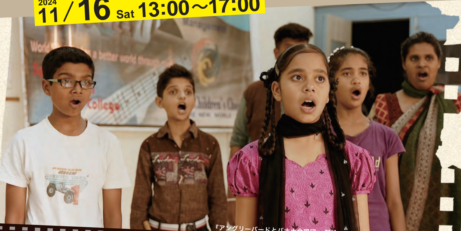
『アングリーバードとバナナ合唱団』 配給：アジアンドキュメンタリーズ